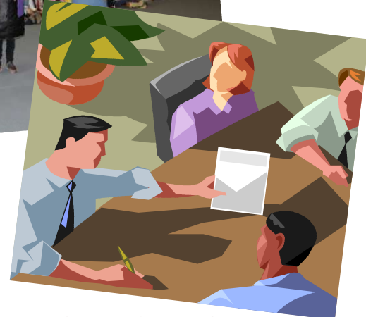
Forum des carrières et des métiers