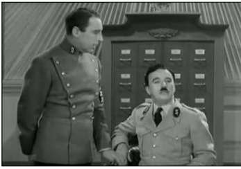
Herring et Hynkel envisage l'extermination des races gênantes