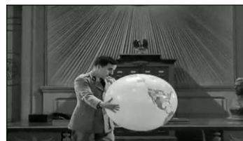
Hynkel veut tenir le monde entre ses mains. Il serre très fort son emprise