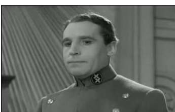
Le maréchal Herring flatte le dictateur en le voyant maître du monde