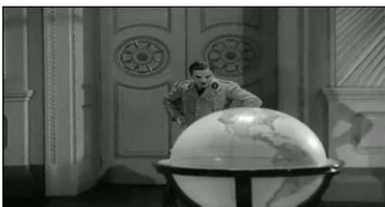
S'intéresse au monde