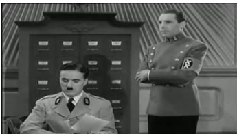
Discours sur les races