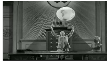
Petite taille d'Hynkel face au monde et dans son palais