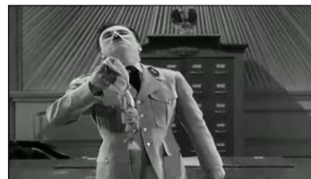
l'explosion du ballon sur une musique de Wagner. L'avertissement s'adresse aussi au spectateur...