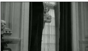
la contreplongée est accentuée : Hynkel seul, perdu dans ses rêves, regarde en l'air. Accentue la folie d'Hynkel