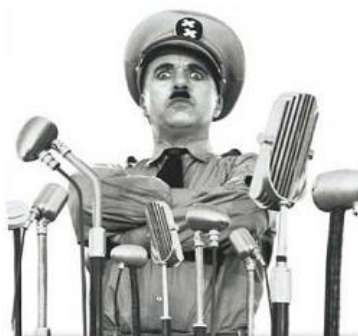
Hynkel durant son discours