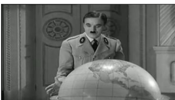
Fin de la séquence