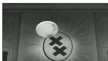
Emblème To double cross= trahir en anglais