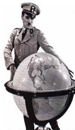
Adenoid Hynkel, Dictateur de Tomania voulant gouverner le monde entier.