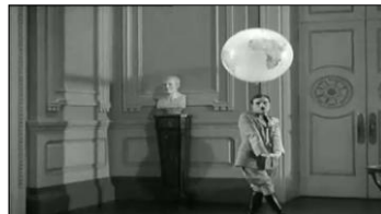
Chaplin et la danse classique : tout mouvement conduit à l'équilibre de la pose