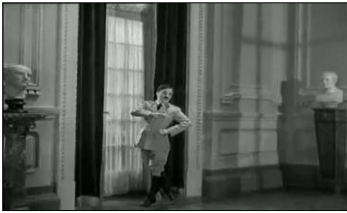
Début du ballet