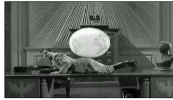
Chorégraphie vers le burlesque