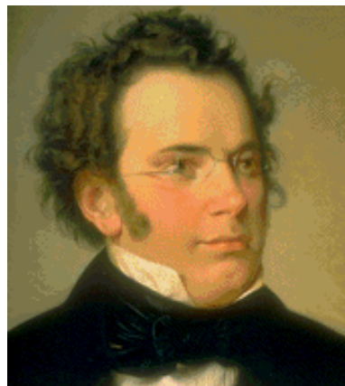
Franz Schubert Compositeur autrichien (1797-1828)