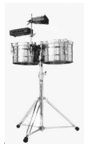
Les timbales et les cloches