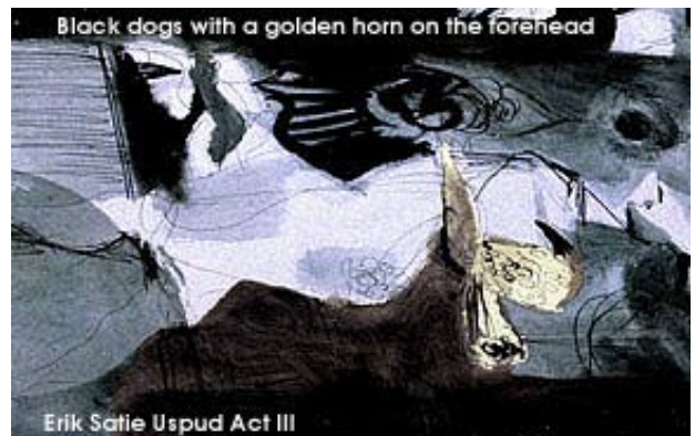
Black dogs with a golden horn on the forehead